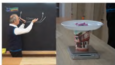
04 Дрон на весах (7-8 кл)

В рамках проекта доступны программы обучения по классам со списком тем и оптимальными сроками их прохождения для подготовки к различным этапам всероссийской олимпиады школьников по физике. На портале проекта представлены видеосеминары с разбором теории и примерами решения задач, методические материалы и даже видео, содержащие решение задач экспериментального тура олимпиады.