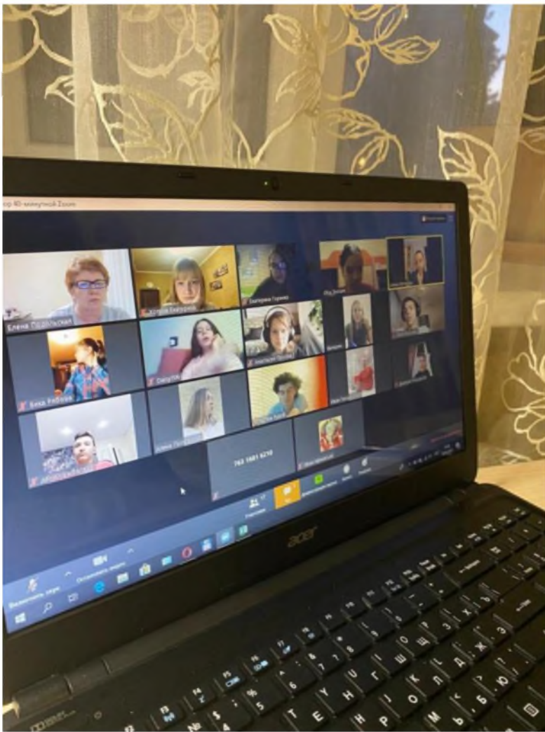
МБОУ СШ №11 г.Волгодонска