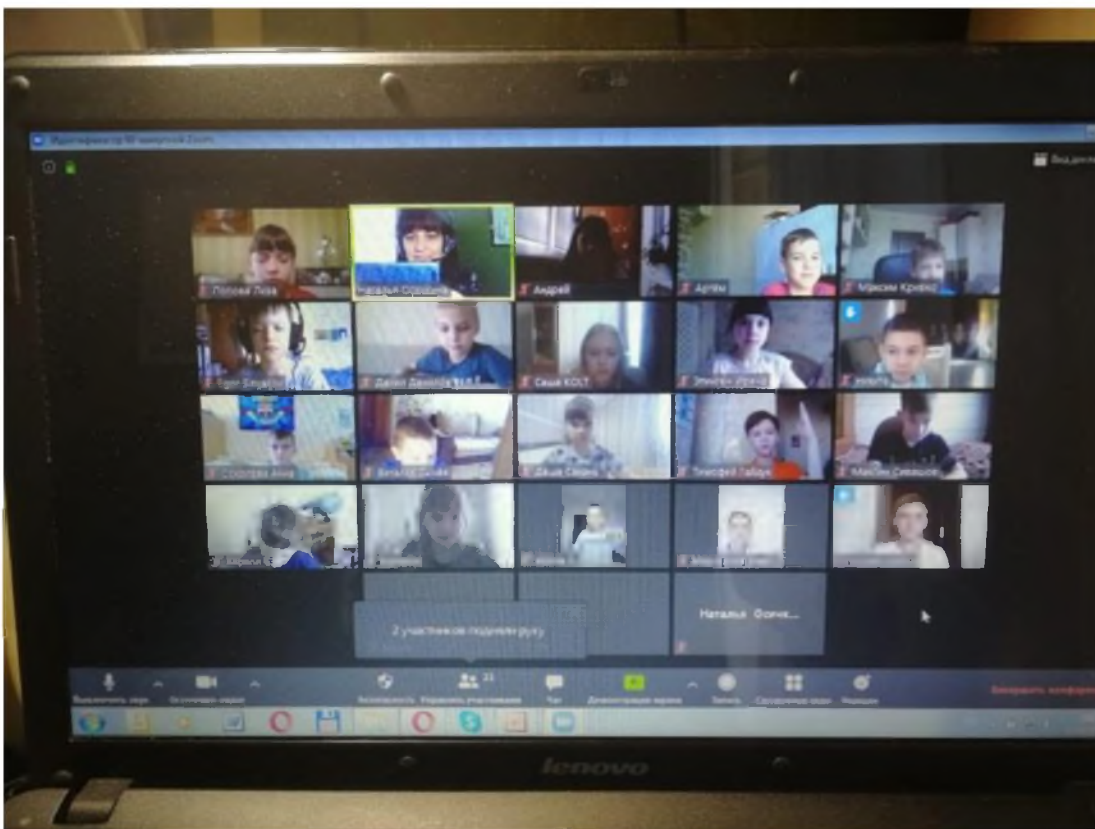
МБОУ «Лицей «Политэк» г.Волгодонска