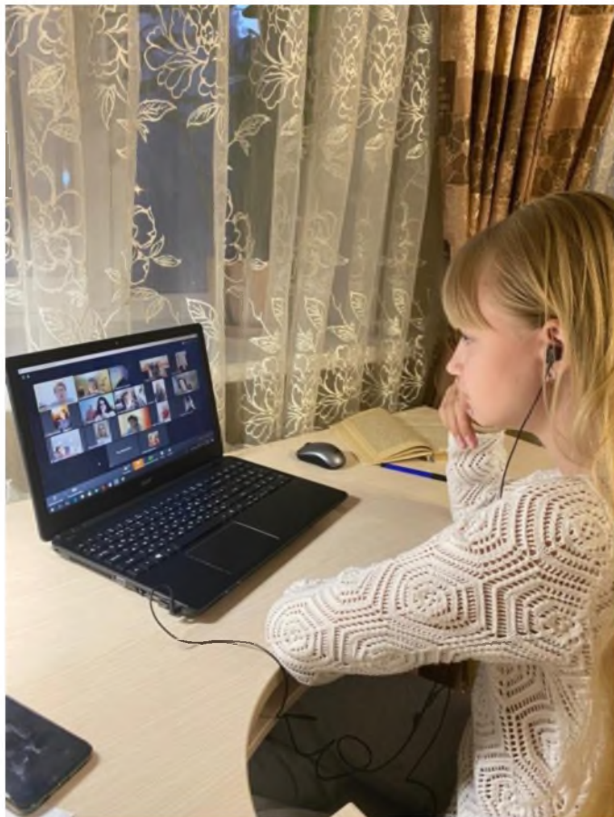
МБОУ СШ №11 г.Волгодонска