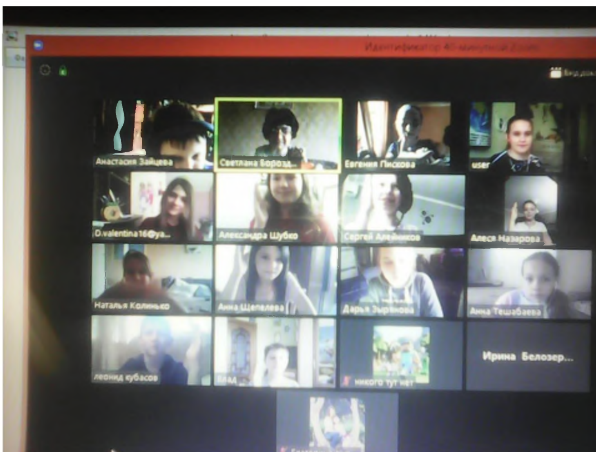
МБОУ СШ №18 г.Волгодонска