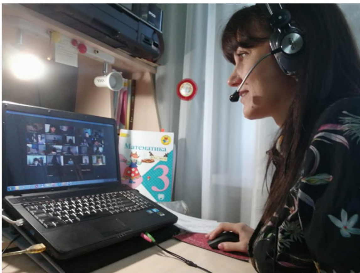
МБОУ «Лицей «Политэк» г.Волгодонска

Используя Google, Zoom, Skype, YouTube и вебинарные комнаты, учителя проводят уроки, часы общения, организуют в новом формате конкурсы, мероприятия внеурочной деятельности.