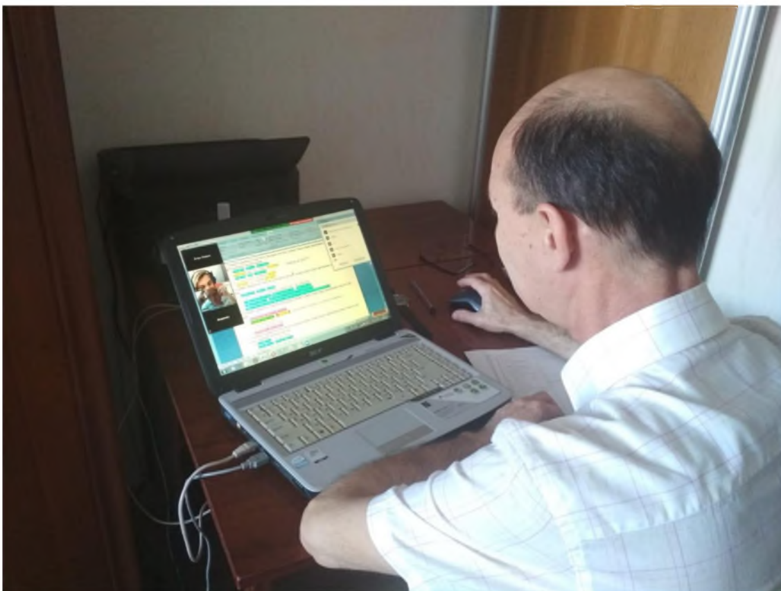
МБОУ СШ №11 г.Волгодонска – урок русского языка