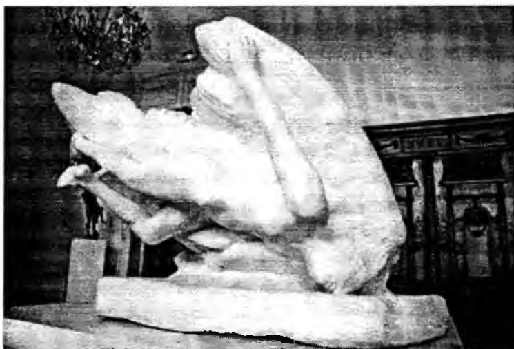
"Победитель" С. Роден 2б