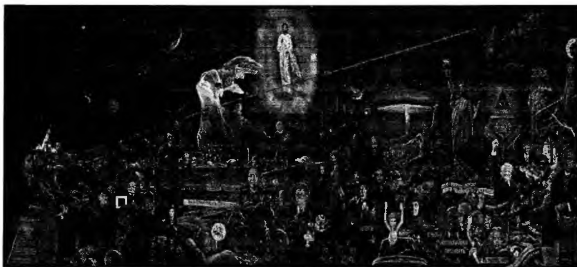
Илья Глазунов «Мистерия»