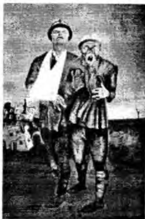
Ю. Пименов «Инвалиды войны» (1926)