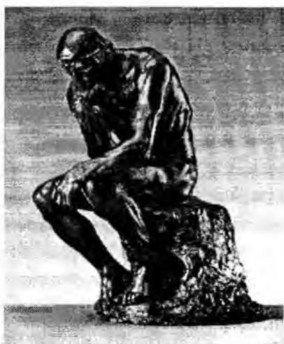
"Мыслитель" С. Роден 2б

2. Рассмотрите иллюстрации, укажите под каждой имя скульптора и, если вспомните, название произведения.