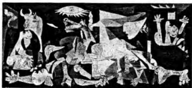
П. Пикассо «Герника» (1937)