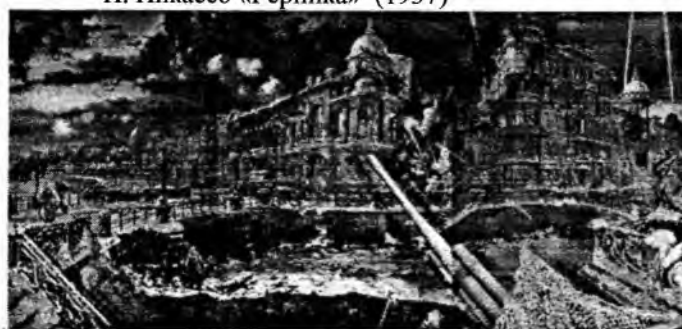
Е. Корнеев «Блокада Ленинграда»