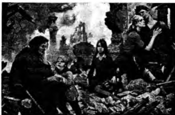
Б. Щербаков «Зло мира»